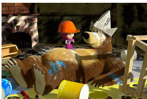
Рис.1. Маша и Медведь